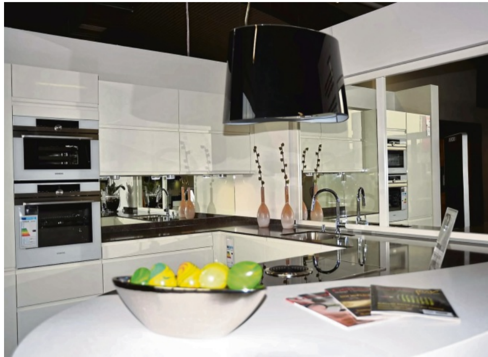
Zeitlos schön: Die vor Ort ausgestellte elegante, grifflose, in Hochglanz weiß lackierte WM-Küche mit Kochfeld mit integrierter Dunstabzugshaube ist nach wie vor ein guter Kauf.

Wer über den Kauf einer neuen Küche nachdenkt, sollte sich unbedingt bei WM Küchen + Ideen informieren und beraten lassen. Denn allein der Besuch von Ausstellungen hilft nur bedingt. Wer