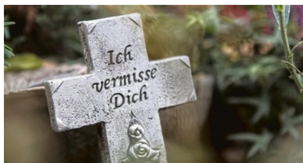
Das Dirigieren der Trauergäste , die im Anschluss an die Beerdigung mit zum Leichenschmaus gehen, sollte von jemandem aus der mittelnahen Familie übernommen werden.