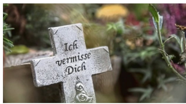
Das Dirigieren der Trauergäste , die im Anschluss an die Beerdigung mit zum Leichenschmaus gehen, sollte von jemandem aus der mittelnahen Familie übernommen werden.

Wer trauert, wünscht sich oft Anteilnahme - aber manchmal kann sie auch zu viel werden. Etwa, wenn es darum geht, wer alles im Anschluss an Trauerfeier und Beisetzung mit zum Trauermahl kommt - und wer nicht beim Leichenschmaus dabei ist.