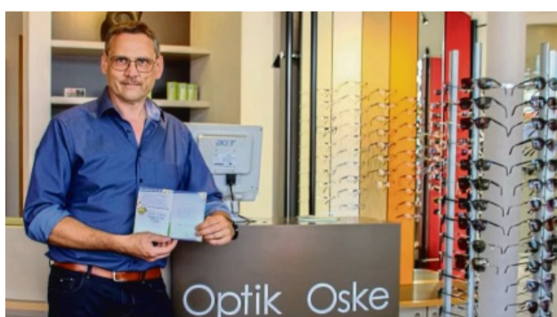
Hier gibt's Stempel: Auch Optik Oske in Ziegenhain beteiligt sich an der Schwälmer Stempel-Rallye.