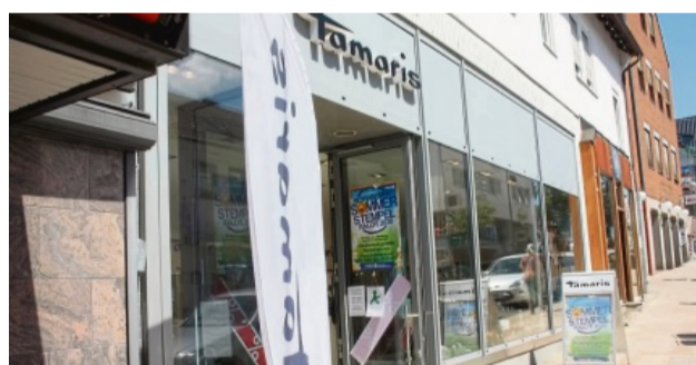
Nicht nur Stempel, sondern auch doppelte Käppies gibt es diese Woche im Schuhhaus Herche.