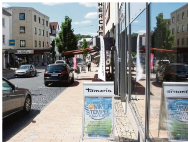
Stempel-Rallye: Mit einer besonderen Aktion wollen die Schwälmer Geschäftsleute die Einkaufsmeilen auf der Wiederholdstraße in Ziegenhain (links) und entlang der Bahnhofstraße in Treysa beleben.

W egen der Corona-Pandemie und den zwischenzeitlichen Geschäftsschließungen haben viele Geschäftsleute und Dienstleister schmerzhaft Umsatzeinbußen zu verzeichnen.