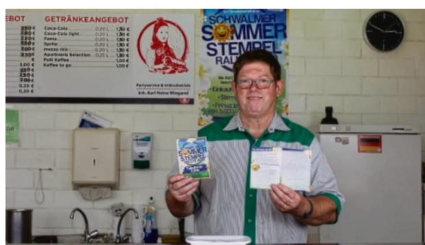
Einen Stempel zum Snack bietet Wiegands Imbiss in Treysa seinen Kunden.